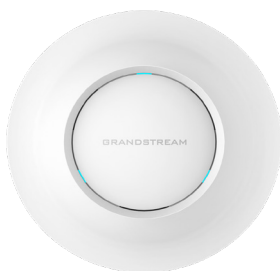
Точка доступа Wi-Fi Grandstream GWN7600 802.11ac Wave-2

*В розыгрыше призов принимают участие все участники Форума, заполнившие регистрационную анкету. Организатор оставляет за собой право заменить приз для розыгрыша