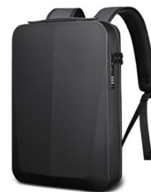
Рюкзак BANGE BG-22201 EVA