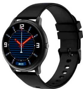
IMILAB Smart Watch KW66